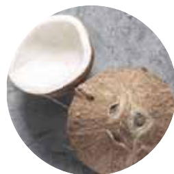
olio di cocco