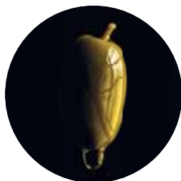
olio di oliva