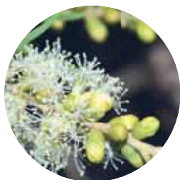
olio di malaleuca

...ma un vero trattamento di bellezza e benessere